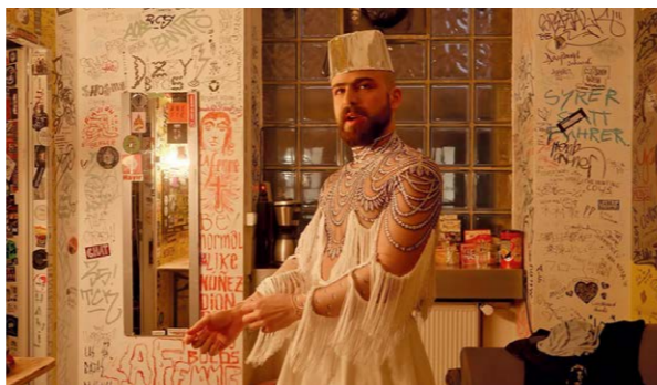
Darvish aus Syrien in «Queer Exile Berlin»

Veranstalter: LSVD Saar / Gruppe Strangers are Friends, in Kooperation mit dem Filmhaus Saarbrücken Kontakt: +49 681 398833, info@checkpoint-sb.de