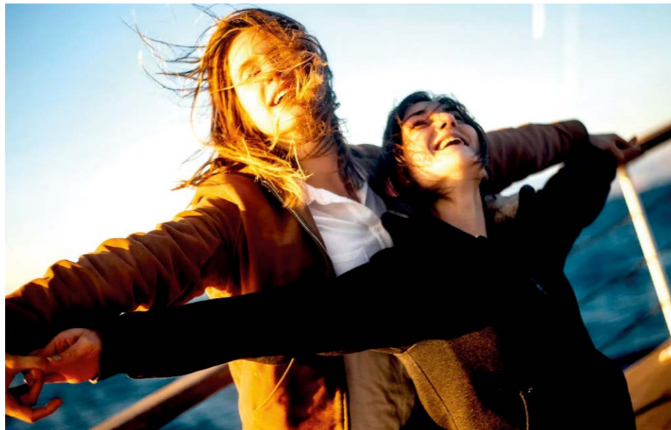
Szene aus dem Film „Djam“

Veranstalter: Stadtbibliothek Saarbrücken Kontakt: +49 681 905-1717, stadtbibliothek@saarbruecken.de